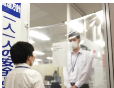
来訪者と接触する窓口にスクリーンを設置し、飛沫感染防止に努めております。