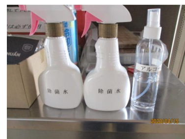
除菌水を全事業所、全車両へ配備し接触感染防止に努めております。